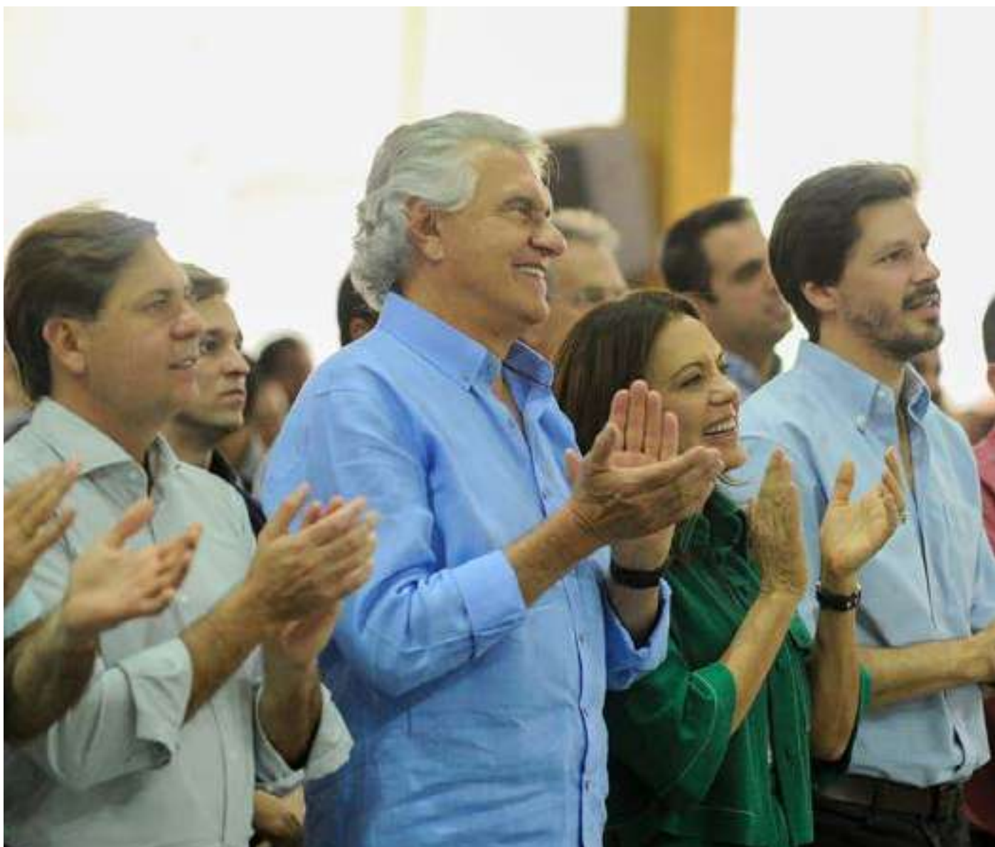
Autoridades participam do encerramento da Romaria de Muquém