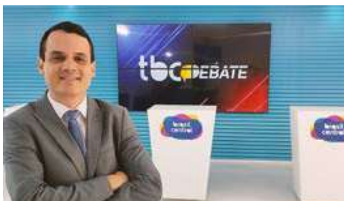
Temporada 2023 do TBC Debate começa na segunda-feira, 21