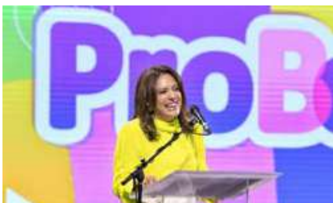
Probem beneficia 4 mil novos estudantes